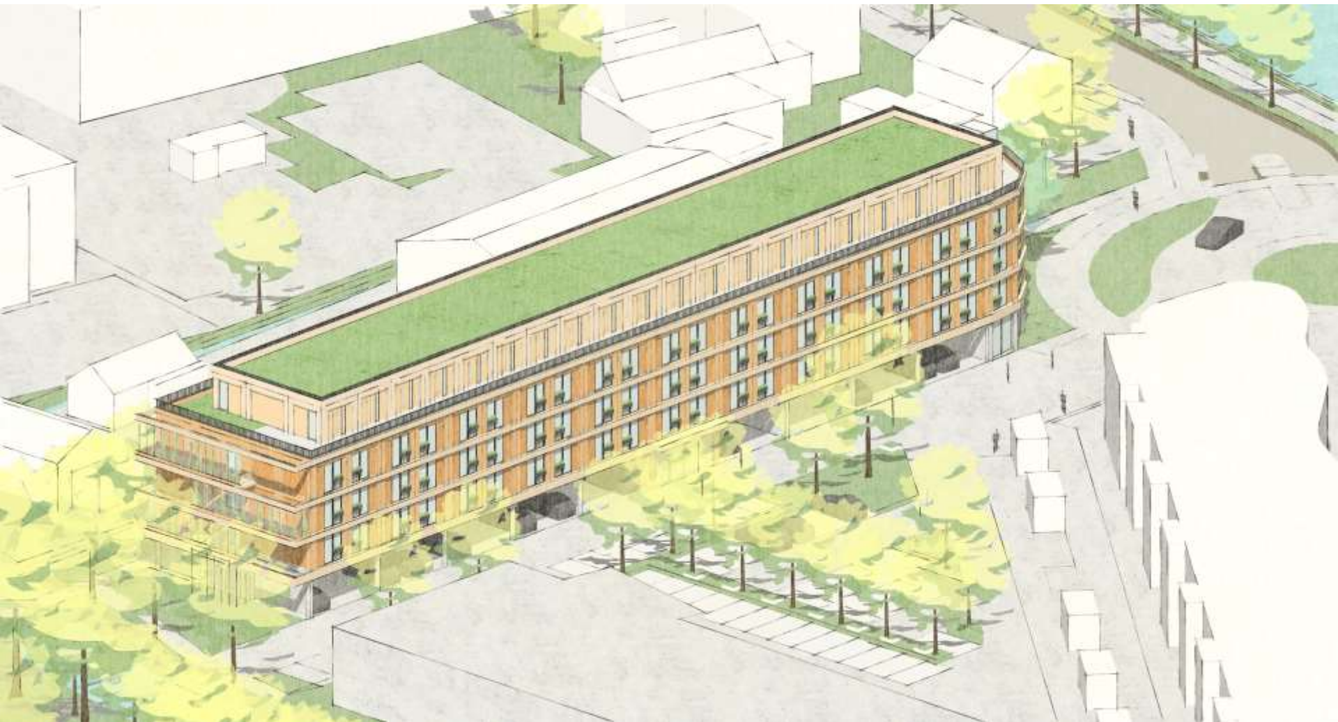
Vogelvlucht impressie vanuit het oosten