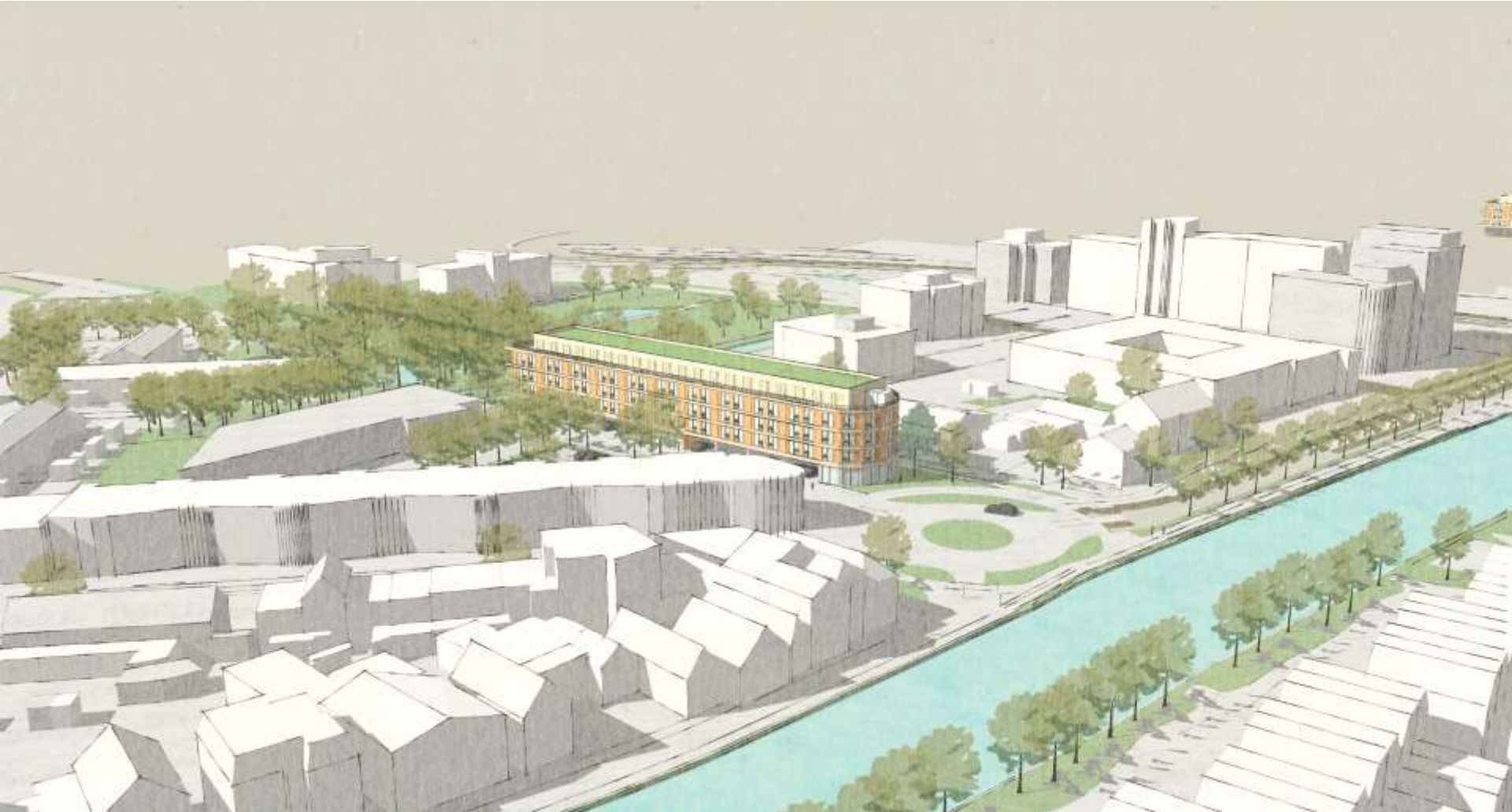
Vogelvlucht impressie vanuit het noorden