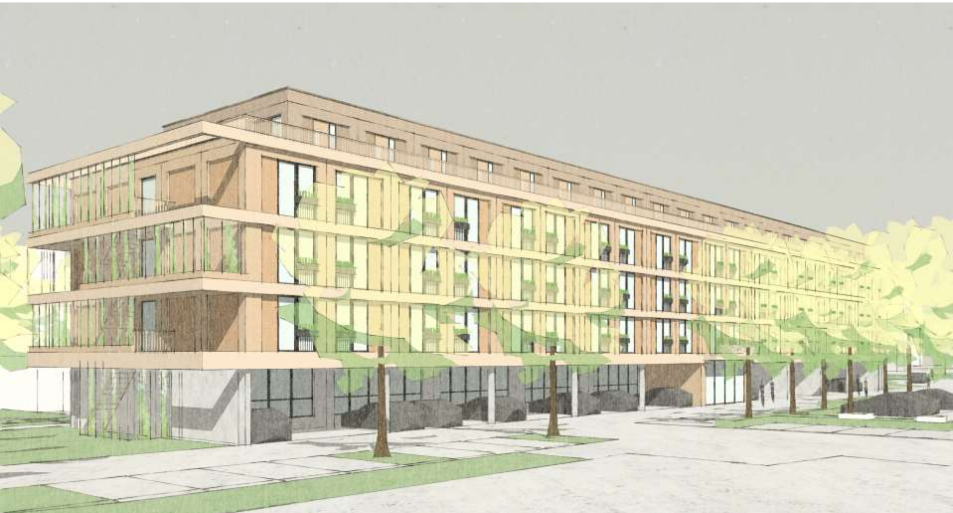
Ooghoogte impressie vanuit het oosten