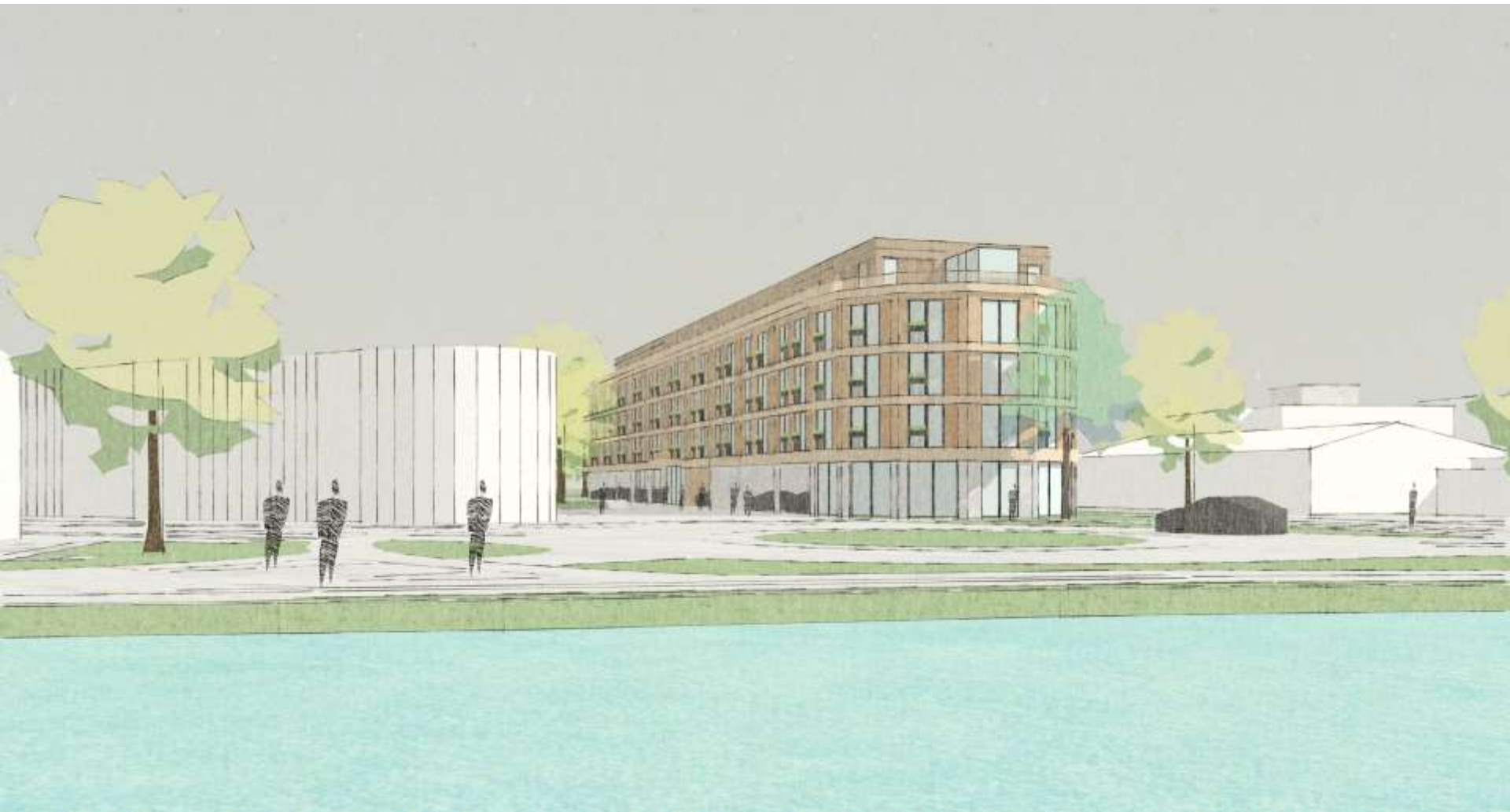
Ooghoogte impressie vanuit het noordoosten